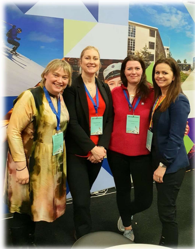
Kynning á VMA og heimavist VMA og MA á sýningunni Mín framtíð - Íslandsmót iðngreina mars 2023

Á haustönn 2023 voru 139 nemendur VMA á sameiginlegri heimavist VMA og MA. Hlutfall VMA nemenda á heimavist hefur farið hækkandi undanfarin ár og hefur heimavistinni tekist að halda nokkuð í íbúafjölda heimavistar. Íbúapróun í nágrennasveitarfélögum skólanna hefur áhrif á nemendafjölda skólanna og nemendum almennt í báðum skólum fækkar. Skólameistari VMA situr stjórnarfundum Lundar sem rekur heimavist VMA og MA. Ársskýrslu fyrir skólaárið 2022-2023 má sjá á heimasíðunni heimavist.is. Á vorönn 2023 var starfsfólk heimavistar með VMA á sýningunni Mín framtíð sem fór fram í Laugardalshöll á sama tíma og Íslandsmót iðngreina fór fram.