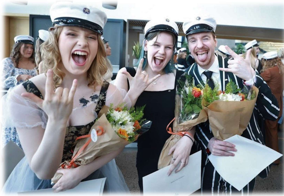
Frá útskrift í Hofi 26. maí 2023

Skólinn hefur stærra hlutverk en áður hvað varðar vinnustaðanámið og mikil breyting sem felst í því að utan um hald á ferilbók er komin til skólanna en áður hélt Iðan utan um námssamninga nemenda. Innleiðing ferilbókarinnar hélt áfram á árinu og gera má ráð fyrir að nemendur, skólar og vinnustaðir þurfi næstu 1-2 árin til að aðlagast breyttu vinnulagi og eftirfylgni.