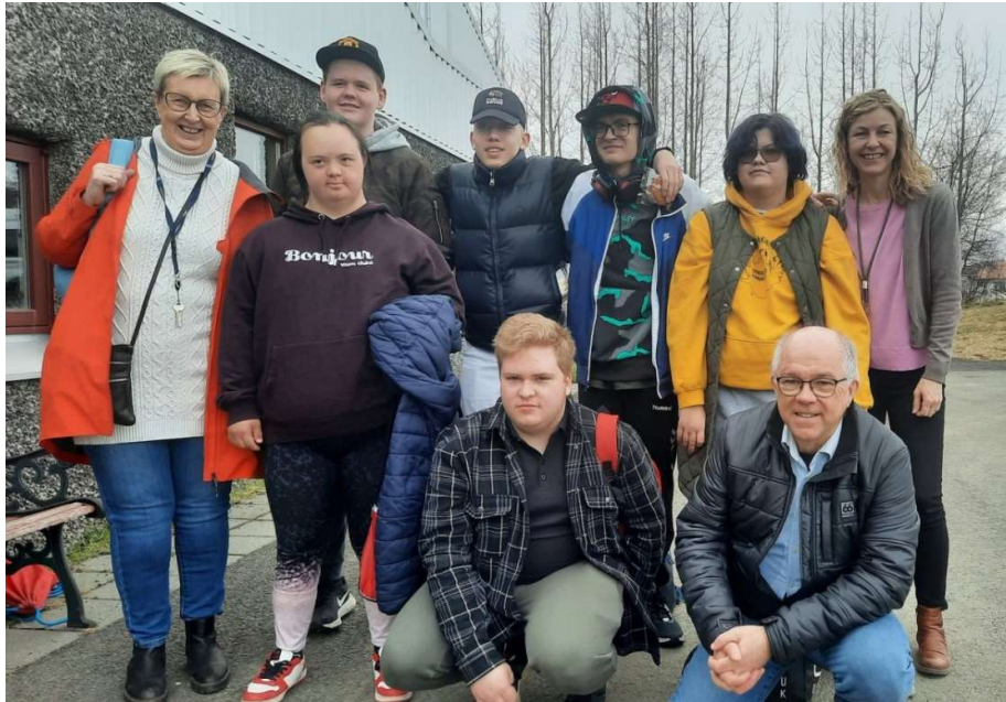
Þátttakendur VMA á Hæfileikakeppni starfsbrauta 2023

Í apríl tóku nemendur á starfsbraut VMA þátt í hæfileikakeppni starfsbrauta sem haldin var í Tækniskólanum í Reykjavík. Hópur nemenda ásamt starfsfólki fór með stuttmynd í keppnina fyrir hönd skólans. Haft var á orði að aldrei áður hafi hæfileikakeppni starfsbrauta framhaldsskólanna verið svo vel sótt. Ekki þarf að orðlengja það að fullt var út úr dyrum og stemningin var ósvikin. Flutt voru þrettán atriði frá jafnmörgum skólum og voru þau af ýmsum toga - söngur, dans, stuttmyndir, bardagalistir o.fl. Allt frábærlega skemmtileg atriði og áhrifamikil.