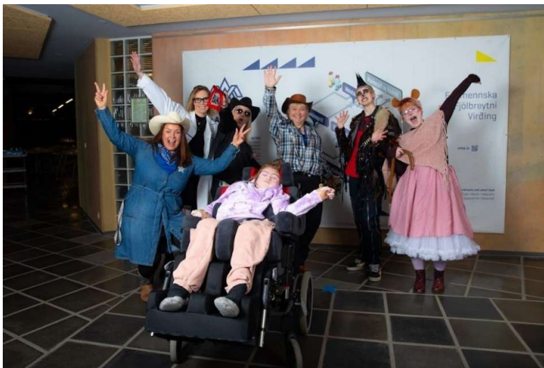
Alltaf líf og fjör á öskudaginn í VMA