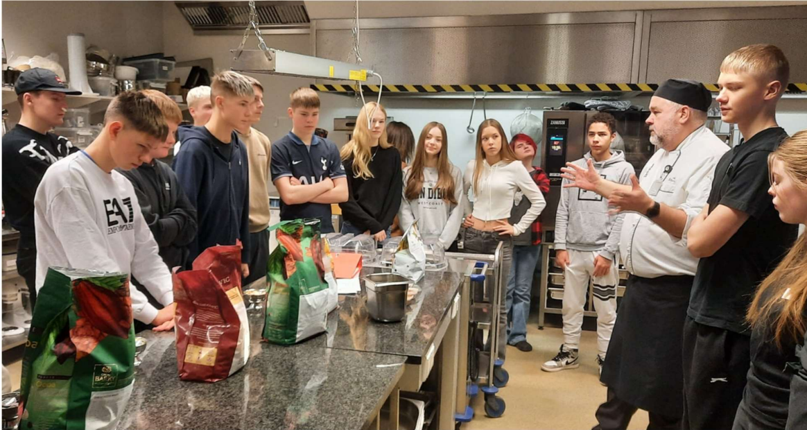
Frá kynningu fyrir grunnskólanemendur

Skólinn tók á móti tæplega 500 nemendum úr grunnskólunum á upptökusvæði skólans, aðallega úr 10. bekk, í lok október. Nemendur fá kynningar á náminu í VMA og þau sem koma frá öðrum sveitarfélögum en Akureyri fá að auki kynningu á heimavistinni.