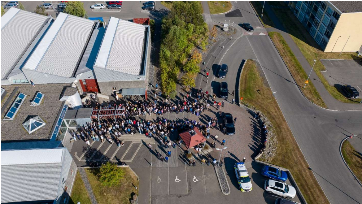
Tekið á móti forsetahjónunum í opinberri heimsókn til Akureyrar 25. ágúst 2023