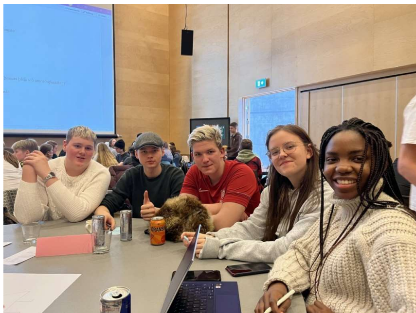
Fulltrúar VMA á Stórþingi ungmenna

Fulltrúar nemenda sitja í skólaráði þar sem þeir halda utan um hagsmuni nemenda. Kosið er í stjórn nemendafélagsins á vorönn. Viðburðarstjóri starfar með nemendaráði að félagslífinu í samvinnu við stjórnendur. Sem fyrr var gott samstarf á milli nemendafélags og stjórnenda skólans á árinu. Fulltrúar í stjórn þórdunu taka þátt í ýmsum verkefnum innan skólans t.d. skipulagningu og framkvæmd VMA hlaups og taka á móti grunnskólanemendum þegar þau koma til að kynna sér námið í VMA.