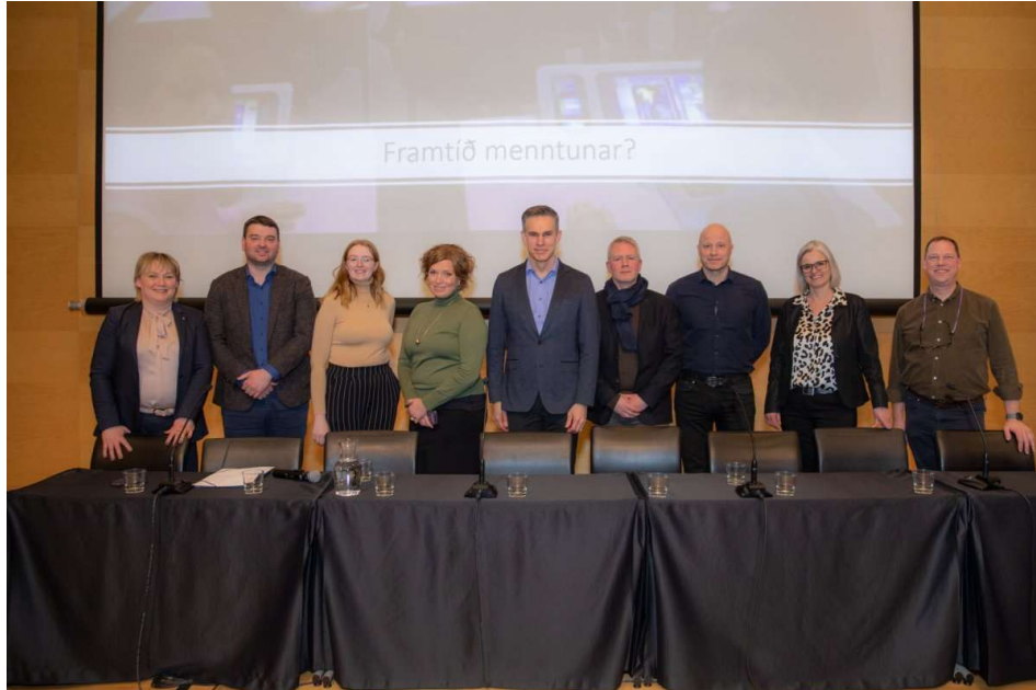
Málþing um hlutverk VMA í nærsamfélaginu var haldið í mars

tveir umsjónarmenn fasteigna, átta þjónustuliðar, níu stuðningsfulltrúar og verkefnastjóri með tölvumálum skólans í hálfu starfi. Formlegar starfslýsingar eru í gæðahandbók fyrir öll störf í skólanum en margar starfslýsingar eru í endurskoðun. Á vorönn 2023 voru tveir kennarar í námsleyfi. Á haustönn voru tveir kennarar í námsleyfi.