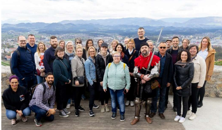
Þátttakendur í BlendVET verkefninu á fundi í Slóveníu