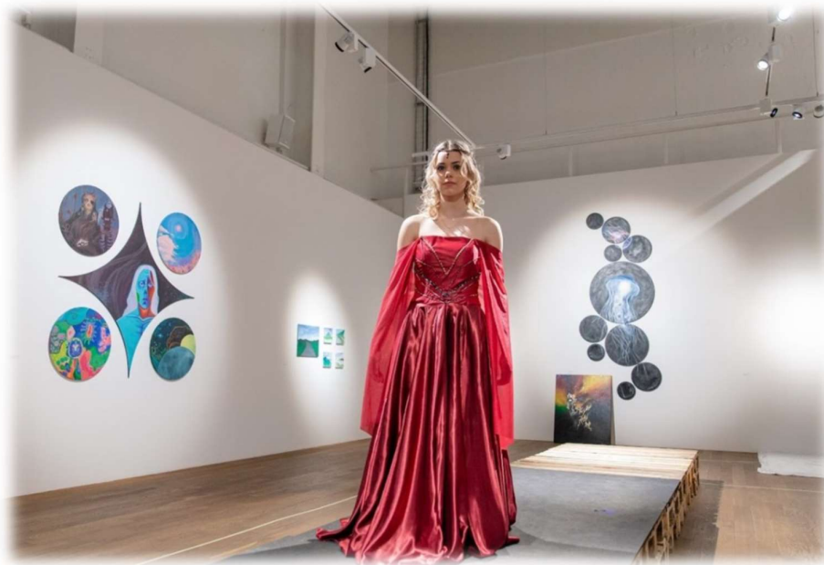
Lokaverkefnissýning á verkum brautskráningarnema á listnáms- og hönnunarbraut í Listasafninu á Akureyri, maí 2023.

Yfirlit yfir fjölda nýnema að hausti í dagskóla má sjá í töflu 4. Þar vekur athygli hve umsóknir karla eru áberandi fleiri en kvenna. Væntanlega endurspeglar það kynbundið námsval sem vikið var að í umfjöllun um töflu 1.